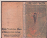
Johannes Heldén: "Collectors edition", 2005.

CAMILLA HAMMARSTRÖM ser tre stipendiater på Bonniers konsthall